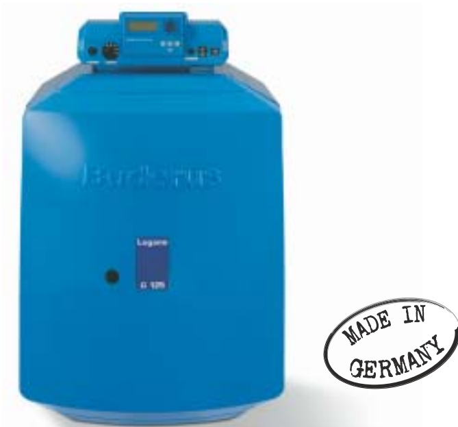
Logano G 125 BE Eco (UNIT) με πίνακα ελέγχου Logamatic 2107

Ο λέβητας G125 στην έκδοση BE Eco (UNIT) παραδίδεται με έναν ενσωματωμένο καυστήρα πετρελαίου. Ο καυστήρας μπλέ φλόγας είναι προρυθμισμένος και δοκιμασμένος από το εργοστάσιο, ώστε να επιτυγχάνει τέλεια αποτελέσματα καύσης και προσφέρει μια υψηλή απόδοση που μπορεί να φτάσει έως και 96%, μειώνοντας παράλληλα στο ελάχιστο την εκπομπή ρύπων.