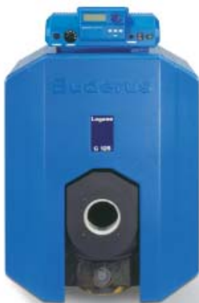
Logano G125 WS

Βασικό κριτήριο στην επιλογή ενός λέβητα αποτελούν η μακροζωία και η οικονομική του λειτουργία. Μια από τις καλύτερες επιλογές που μπορούμε να σας προτείνουμε είναι ο μαυτεμένιος λέβητας χαμηλών θερμοκρασιών Buderus Logano G125 WS. Ο λέβητας G125 WS, κορυφαίας τεχνολογίας και γερμανικής ποιότητας κατασκευής, συνιστάται για όλες τις «μικρές» εγκαταστάσεις θέρμανσης με καυστήρα πετρελαίου ή αερίου... Και όλα αυτά σε μια εξαιρετική σχέση απόδοσης-τιμής.