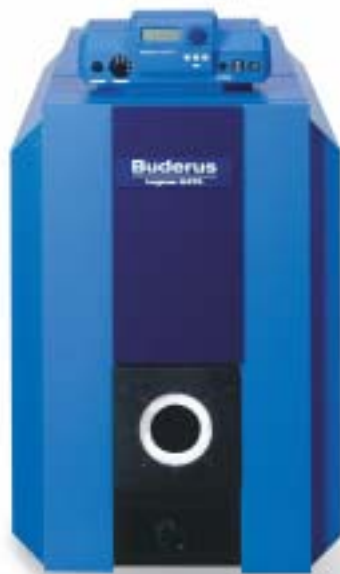
Logano G215 WS

Ο λέβητας χαμηλών θερμοκρασιών Buderus Logano G215 WS αποτελεί δείγμα της προηγμένης τεχνολογίας και κορυφαίας ποιότητας της Buderus. Ο λέβητας διαθέτει τρεις διαδρομές καυσαερίων και είναι κατασκευασμένος από το ειδικό κράμα χυτοσιδήρου GL180M, ένα μαντέμι υψηλής ποιότητας και εξαιρετικής αντοχής στις θερμικές καταπονήσεις, καθώς και απόλυτα ανθεκτικό στα όξινα συμπυκνώματα των καυσαερίων.